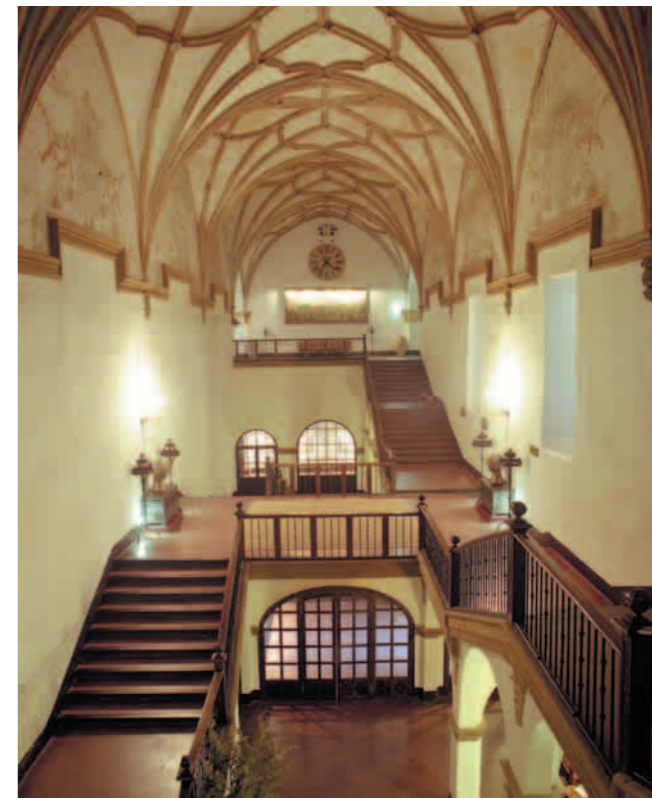
Escalera Conventual Hotel