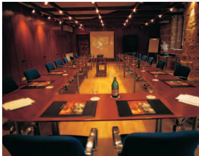
Sala de Convenciones