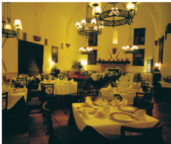
Restaurante Reyes de Aragón