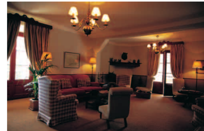
Salon de lectura Don Gaudrido

The hotel has available various rooms ideally suited for business meetings, seminars and wedding celebrations which the beautiful setting of the monastery makes unique and memorable. Guests can enjoy aperitifs in the splendid gardens, dine in the gothic restaurant and enjoy gatherings in various spaces. Monasterio de Piedra is also an ideal place to celebrate christenings, birthdays, first communion, silver wedding, etc.