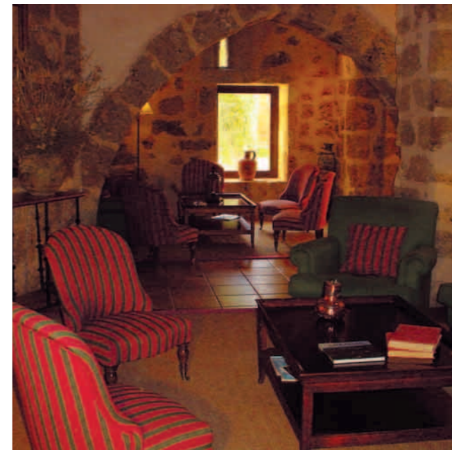
Salón El Granero