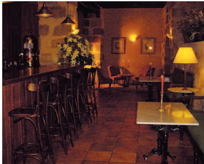
Bar El Granero